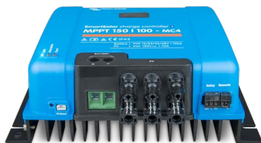
Contrôleur de charge solaire MPPT 150/100 MC4 sans écran