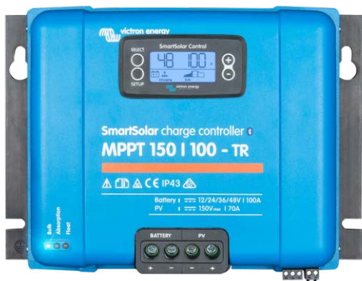
Contrôleur de charge solaire MPPT 150/100-Tr avec un écran enfichable

Elle compense les tensions de charge Float et d'absorption en fonction de la température.